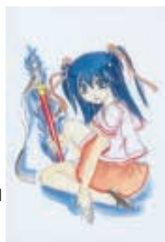
▶ P.N 小林