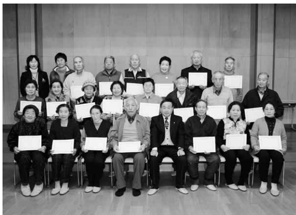
赤城原老人会のみなさん