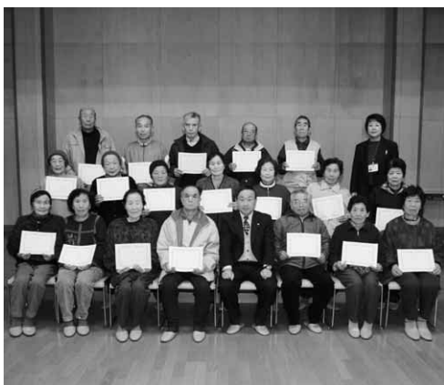
森下老人会のみなさん

この筋力トレーニングは転倒予防を目的に、簡単ないくつかの運動を定期的に行うもの。初めは慣れない運動に苦労していた参加者も、だんだんと運動が楽になってきたようで、生活に必要な筋肉が鍛えられてきたのを実感していました。