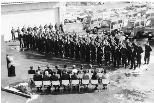
勢ぞろいした団員たち