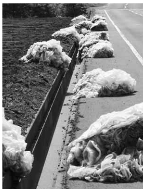
路肩や畑に置かれている廃マルチ

側溝を詰まらせる原因は土砂だけではなく、畑や道路に置かれていたゴミが側溝に流れ込んで詰まる原因になることがあります。特に最近では、道路脇やガードレ