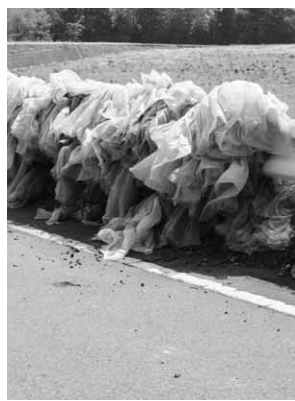
ガードレールにかけられている廃マルチ

廃マルチはJAなどで行う回収により適正に処理し、道路脇やガードレールに置かないようご協力をお願いします。