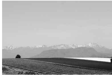
絶景ポイントを発見!!思わずパシャリ。 場所は追分ワイン畑付近です。