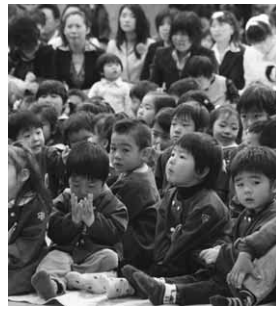
19年度入園式の様子(第一保育園)

■条件 ①家庭の外で仕事をすることが普通である ②家庭で幼児と離れて家事以外のことをすることが普通である