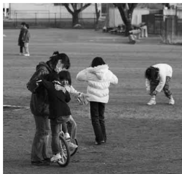
◆子どもたちと一緒に遊んでみませんか