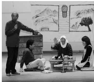
「ぐんま認知症ポケー座」による寸劇

今回行われた講座では、認知症の症状に対する良い対処や対応方法についてのヒントとなる寸劇や講座を行い、最