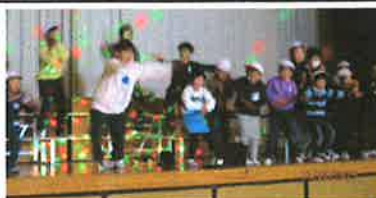
いつの間にか“お立ち台”のステージ