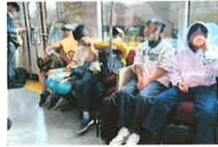
慣れた感じ出てる