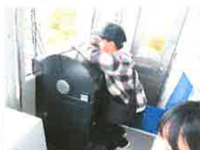
シーサイドライン 一番前