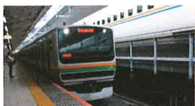
上野東京ライン(東海道線直通)