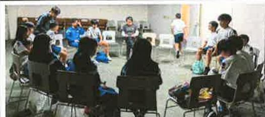
観た物・感じた事・考えた事、一人一人違うのです！

1日目のおわりは『他班の1日を知りたい！』 となります 『振り返り』が大切です 何が起こったのか、話してみると、とても楽しいのです！