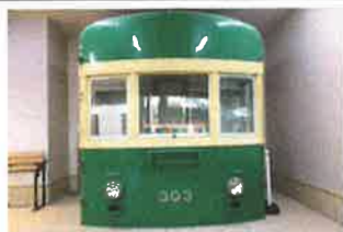
江ノ電カッターモデル？