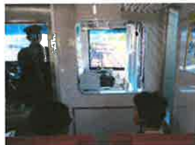
京急先頭車両 これいい！