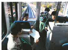
シーサイドライン 一番後ろ