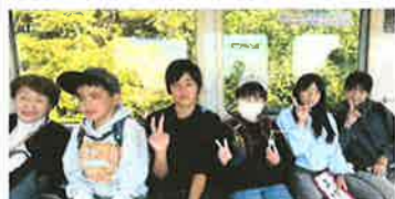
“電車の旅” 素敵過ぎます！