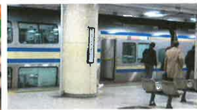
横須賀線(久里浜行き)