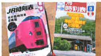
“電車の旅” の強い味方！