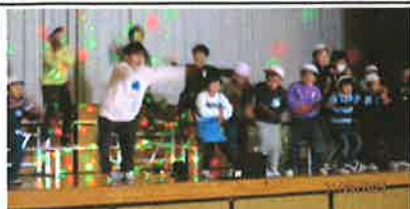
ステージ上のリーダーズ