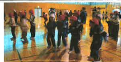
ステージ下もかなり盛り上がっています

軍隊式？「気をつけ・前へならえ」無しで 子どもたちは判断して行動できます そして、学校はとても素敵になるのです(加藤)