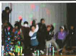
みんな心が解放されています！