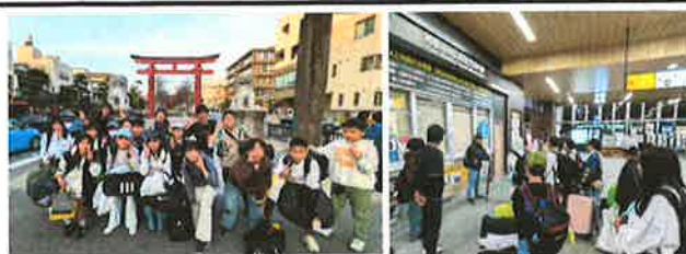
2日目16時頃 名残惜しい！