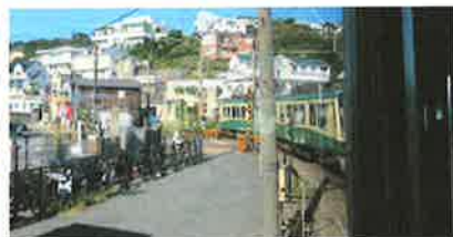
江ノ電の車窓から...