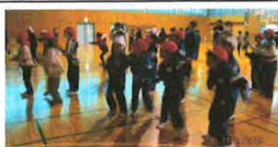
ステージ下も盛り上がってます