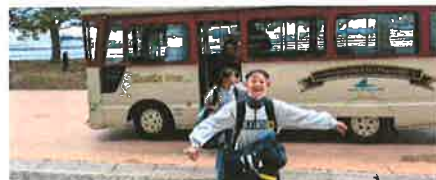
あれ？バスにも乗っていたのですね

今回“電車の旅”で確信しました 東小の子どもたち【勇気がある・自由に考えて判断し行動する力がある】すばらしい！（加藤）