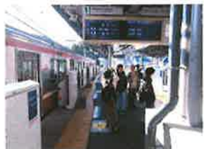
浦賀行×逗子行のみっけ！