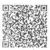
いのち・つなぐサポートサイト

■ 群馬県こころの健康センター電話相談 027-263-1156 月～金曜日 (祝日を除く) 午前9時～午後5時 土日祝日 (午前9時～午後1時30分) も相談を随時延長中です。 延長期間はこころの健康センターホームページでご確認ください。