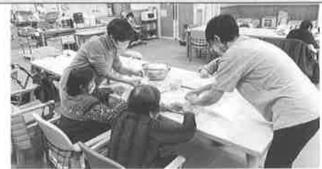
デイサービス食レク