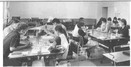
地域ケア推進会議