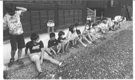
東学童夏休みイベント