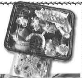
美味しい手作り弁当♪

今後も昭和村社会福祉協議会では、継続的に高齢者ふれあい交流会の開催を予定しておりますのでお住まいの民生委員から開催のお知らせがあった際には、是非ご参加ください。