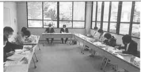
法人後見運営委員会