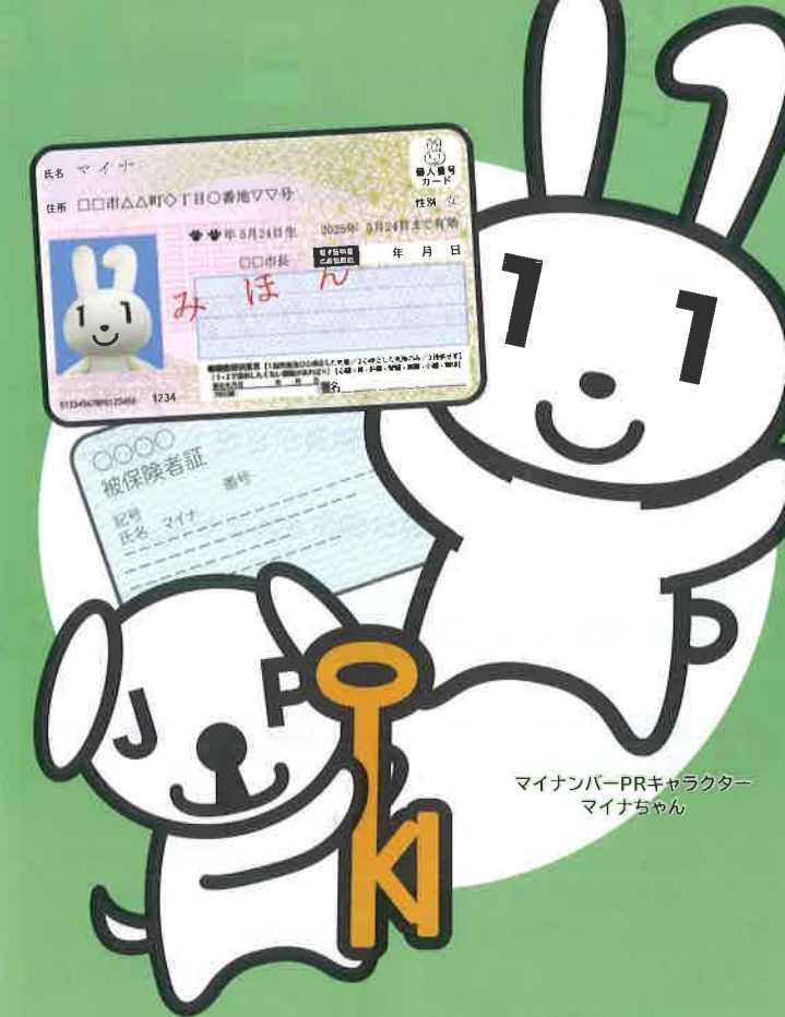
マイナンバーPRキャラクター マイナちゃん