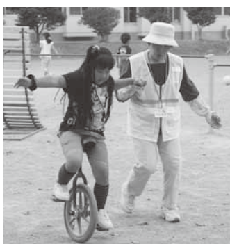
子どもたちと遊ぶ安全管理員(東小子ども教室)

東小子ども教室では今後、さまざまな場での活動・協力体制に取り組んでいきたいとしています。