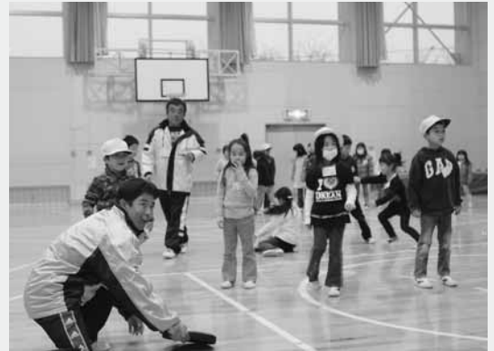
体育指導委員とドッチビーを楽しむ子どもたち（南小）