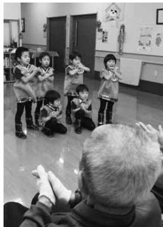
元気いっぱいの踊りを披露(美ら寿)