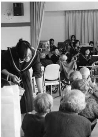
曲当てクイズは大盛況

コンサートでは、歌謡曲や演歌など、お年寄りになじみのある曲を中心に、クリスマスソングなど様々な楽曲を披露。