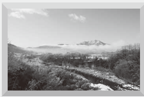
幻想的な雪景色の子持山と片品川 (1月8日 二恵橋)