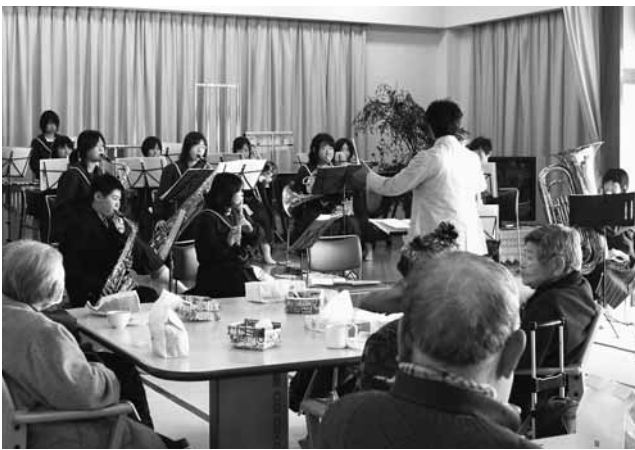
昭和中プラスバンド部が演歌や歌謡曲などさまざまな曲を披露

曲当てクイズなども行われ、全員で盛り上がりました。 会場となった昭和の湯大広間にはの忘年会に集まったお年寄り58人が、部員たちの演奏に聴き入りました。