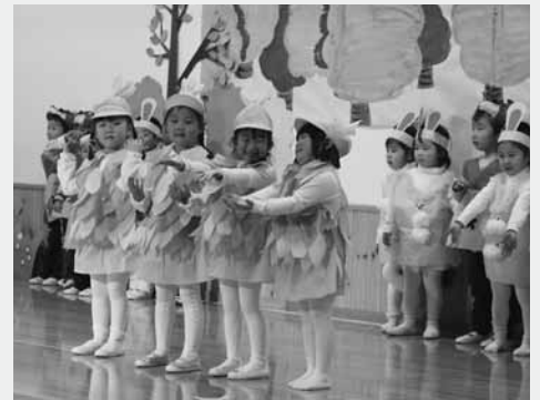
かわいらしいオペレッタを披露

年中組の園児が演じたのはオペレッタ「森へ行こう」。劇中の園児のかわいい演技と衣装に会場からは大きな歓声が上がっていました。