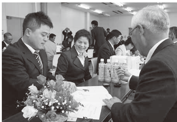
昨年は10組の家族が協定書に調印

後継者の就農・結婚・経営移譲などにより経営形態の変化が生じた場合などには、協定書の見直しもできます。