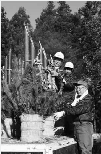
門松を制作する清流の会会員