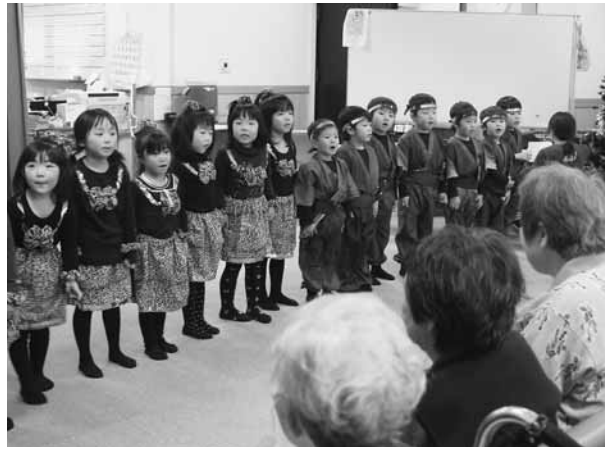
元気な声で歌を披露(デイサービスセンター)