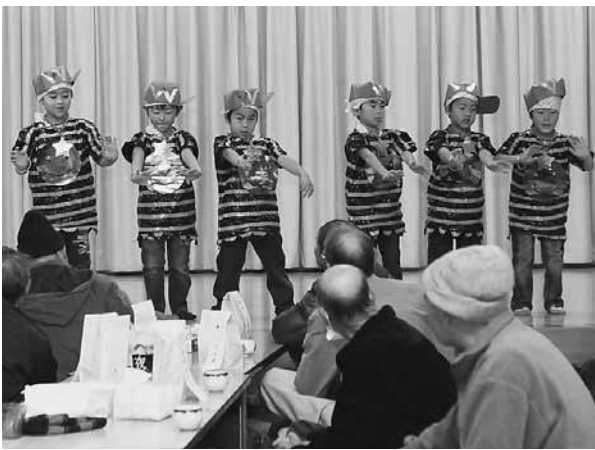
元気いっぱいに踊りを披露

最後は、サンタやトナカイの衣装を身にまとったお年寄りの代表と社会福祉協議会の職員から園児一人ひとりにプレゼントが手渡され、園児たちは「ありがとう」と笑顔を浮かべていました。