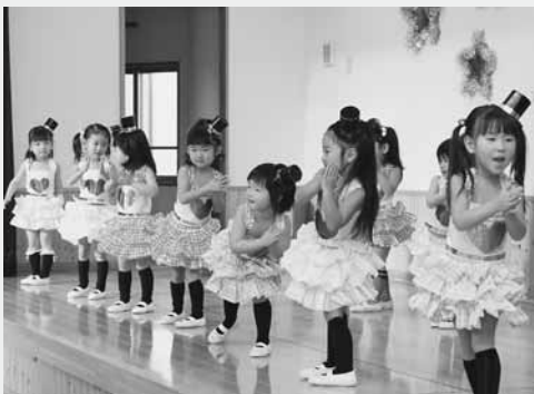
かわいらしいダンスを披露