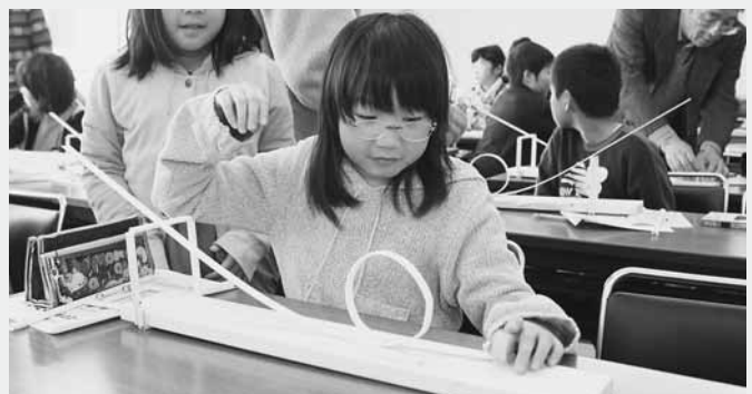
上手に転がるかな？

完成したジェットコースターを転がる鉄球の動きと、レールの終わりに置いた強力な磁石にキャッチされる様子を楽しみました。