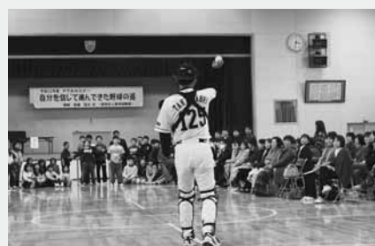
子どもたちとキャッチングの実演