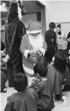
サンタさんからプレゼント

鮮やかな衣装に身を包んで、元気いっぱいにお遊戯を披露する園児たちに、お年寄りの皆さんから大きな拍手が上がりました。また、「森のくまさん」など数曲を一緒に合唱するなど楽しく交流しました。