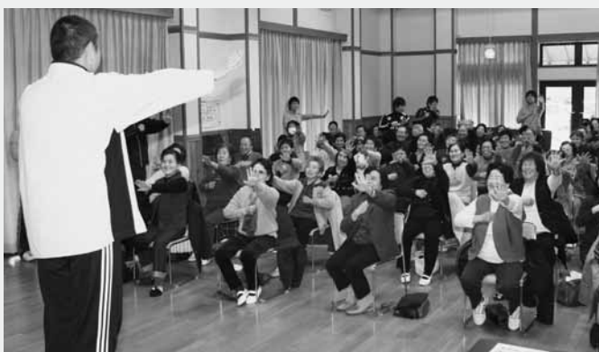
筋トレ体操を行う参加者

介護予防サポーターが主催する筋トレ講座が12月15日、村地域活性化センターで開催されました。