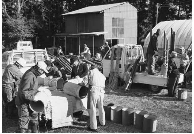
会員の手によって手際よく制作されていく門松