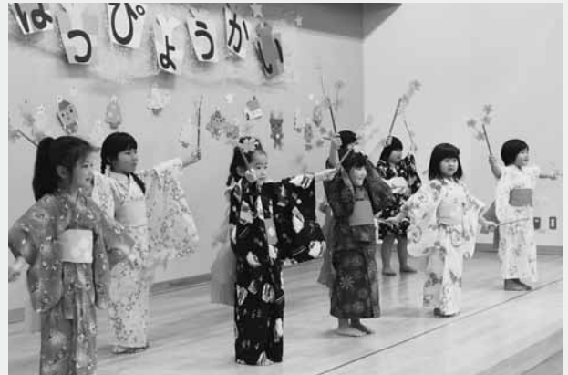
華やかな浴衣姿で踊る園児たち

年中組の女の子によるお遊戯「花あそび」では、華やかな浴衣姿の園児たちがかわいらしい踊りを披露。集まった保護者たちから大きな拍手が上がっていました。