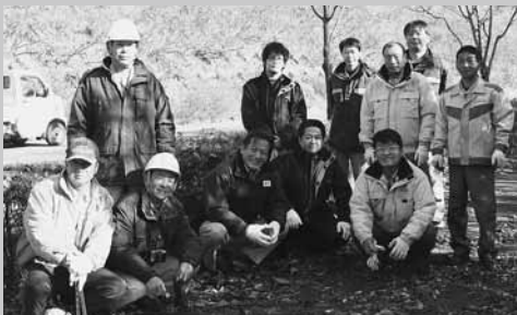
清掃活動を行った4社企業のみなさん

この日は11人が参加し、午前10時からおよそ1時間半にわたって昭和インター線沿いのゴミ拾いに汗を流しました。