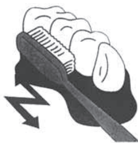
●軽い力で小刻みに動かしてみがく

原因になります。歯磨きの時に舌もきれいにしましょう。口臭は丁寧な歯磨きと必要な治療を受けることで改善されます。