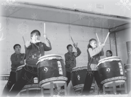
勇壮な響きで開会を告げる生越太鼓