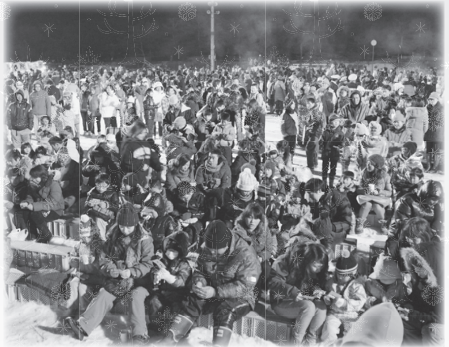
たくさんの人たちでにぎわったビンゴ大会