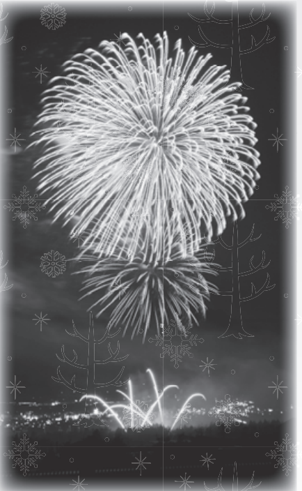
真冬の夜空を彩る雪上花火