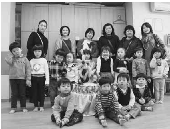
クンポ市の保育園を見学

最終日には、世界遺産(文化遺産)に登録されている昌徳宮の建造物群、北村韓屋村の散策などを行いました。