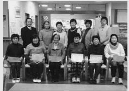
菜の花館(ひまわり会)の皆さん

菜の花館では毎週金曜日の午後7時30分から、日立研修所では毎週木曜日の午後2時から、それぞれらくらく筋トレ体操に取り組んでいます。