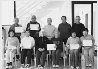
日立研修所(妖精の森サロン)の皆さん