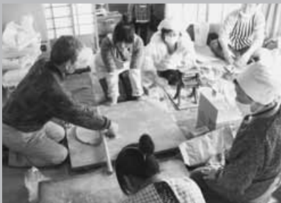
そば作りをする会員ら

そば会には、お年寄りから子どもまで、およそ60人が参加。同会会員らが作った出来たてのそばを味わいました。また、高齢者には民生委員を通じて声掛けがされ、会場まで出掛けられないお年寄りには、出前も行われました。