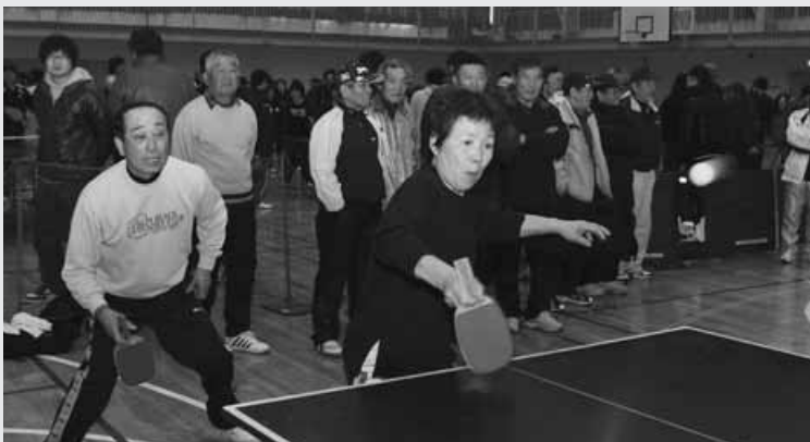
熱戦を繰り広げる参加者