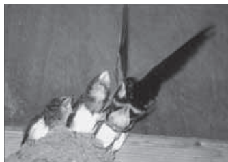
「ツバメの餌くれ」 横坂 先夫