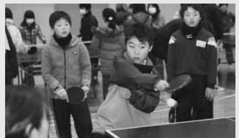
この一球は、はずせない!