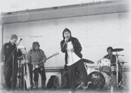
会場を盛り上げた「SDM」