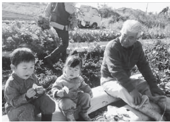
「じいちゃんと畑仕事」