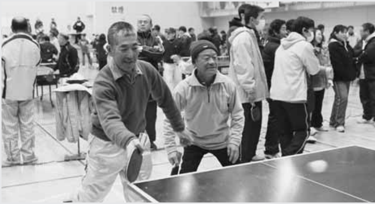
一球一球が真剣勝負

村体育協会が主催する第44回ピンポンフェスティバルが2月5日、社会体育館で開催されました。