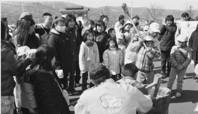
みんなで楽しくお餅つき