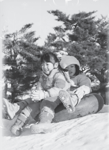
子どもたちに大人気のスノーチュービング