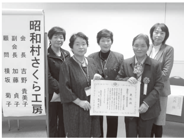
表彰を受けたさくら工房の皆さん

また、農家レストラン「昭和村さくら工房」での活動のほか、友好都市である横浜市、取手市、玉村町での商品販売やこんにゃくづくり体験を行うなど、交流を深める活動も行っています。