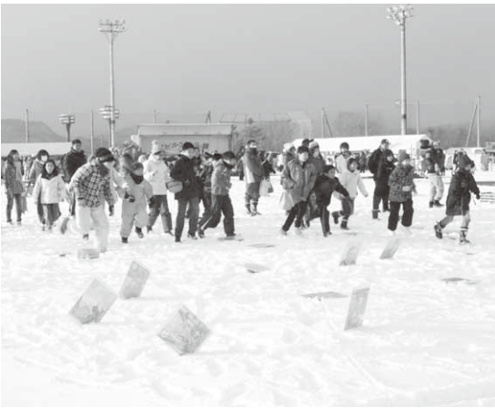
雪上で行われたかるた大会