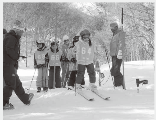
目標タイム目指してスタート！

また、午後にはスキー大会が行われ、子どもたちはレッスンの成果を披露。それぞれの目標タイムを設定し、どれだけそのタイムどおりにコースを滑れるかを競いました。