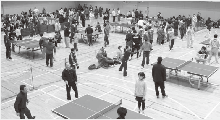
およそ350人が集まり熱気に包まれる会場

村体育協会が主催する第47回ピンポンフェスティバルが2月8日、社会体育館で開催されました。