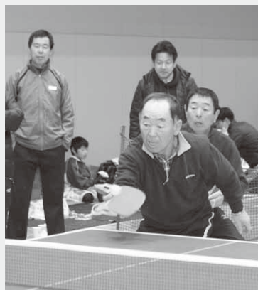
熱戦を繰り広げる参加者