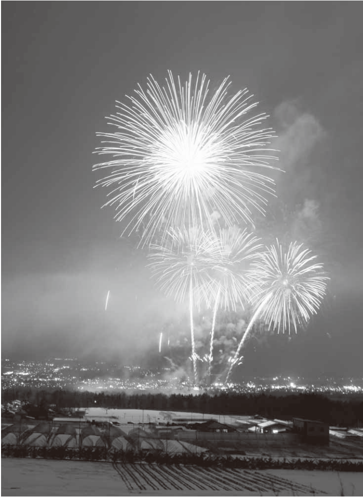
真冬の夜空を鮮やかに彩った雪上火火

イベントのメインとなる雪上火火は、午後7時からスタート。およそ5,000発の花火が40分間に渡って打ち上げられ、色とりどりの花火が澄み切った夜空を鮮やかに彩りました。