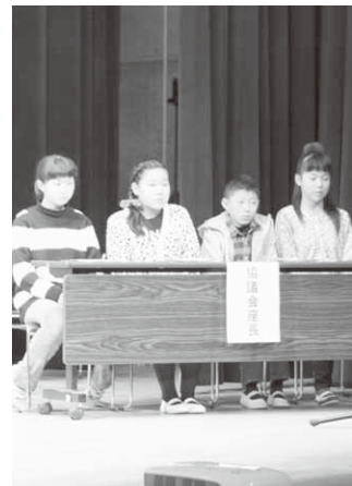
活動を発表した東小児童

第一部では、1月15日に行われた「昭和村いじめ防止子ども会議」から村内各校を代表して、東小学校より4人の児童