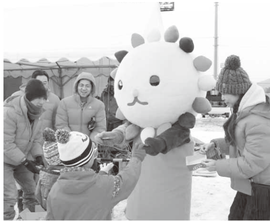
「ひゅーどんどん」がチョコレートを配布