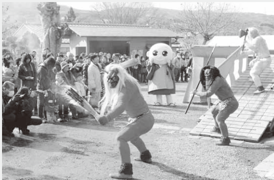
境内を練り歩く鬼たち