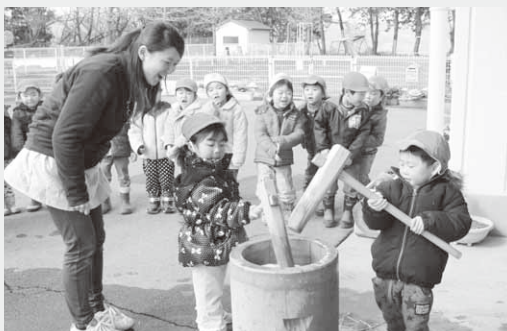
お餅つきを楽しむ園児たち

準備が整うと各クラスの園児たちが順番に小さな杵を使い「よいしょ！よいしょ！」と大きなかけ声をあげ、お餅つきを楽しんでいました。