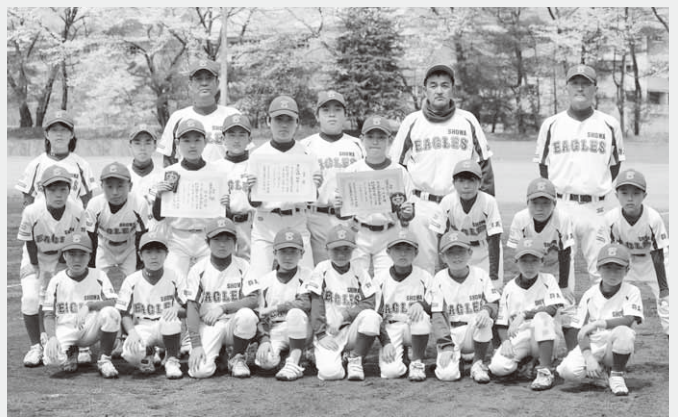
準優勝に輝いた昭和イーグルス

また、この大会で優勝、準優勝したチームは4月25日から5月4日の日程で行われた同県大会に出場しました。