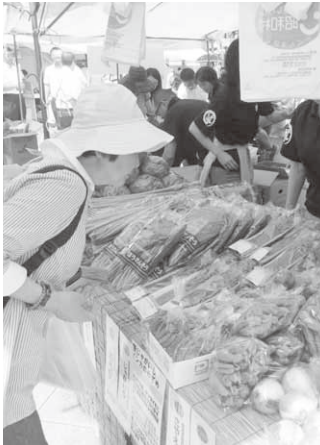
村テントには新鮮野菜がずらり

「毎年この野菜を楽しむにバザーに來ています」と再び訪れるお客さんも多く、村のテントは連日賑わいました。