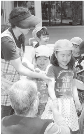
お年寄りの皆さんと握手

また、交流会の最後には園児たちが「いつまでもお元気でいてください」とあいさつ。お年寄りのみなさんと握手をしてお別れをしました。