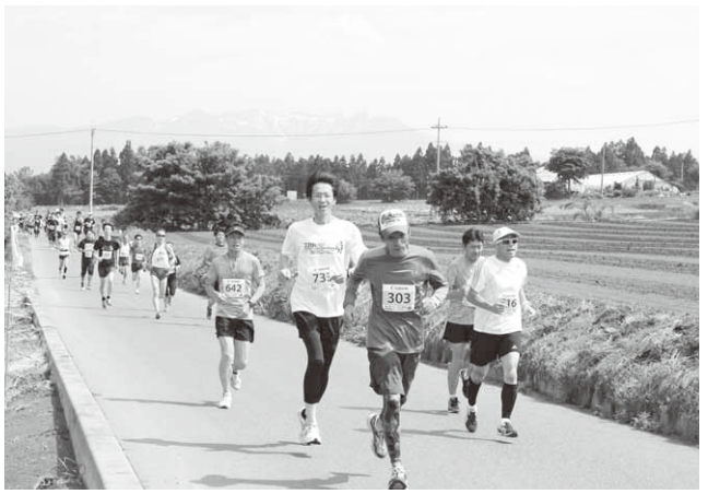
新緑のコースを走り抜けるランナー