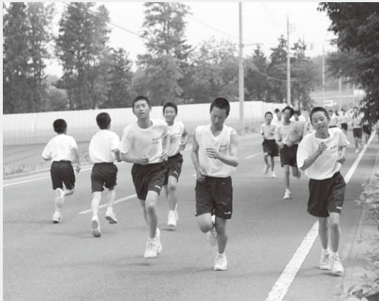
望郷ラインを快走する生徒たち