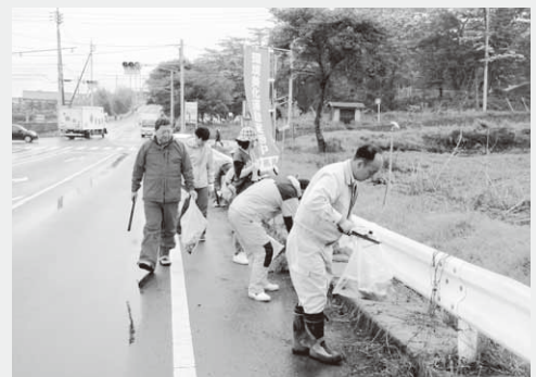
悪天候のなか行われた清掃活動

当日は雨の降る悪天候となりましたが、290人が参加。同公園周辺や望郷ラインでの清掃活動を行いました。