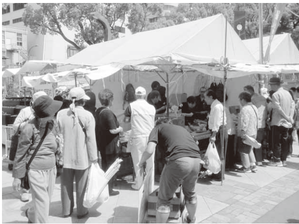
大勢の人でにぎわう昭和村のテント