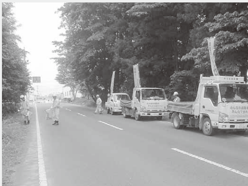
次々と集められていくゴミ

作業には、石坂建設(株)、(株)高橋舗道、兵藤建設(株)の3社が参加。道路わきに捨てられた空き缶などのゴミ拾いを行いました。