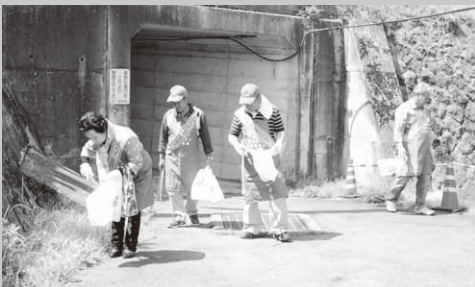
ゴミ拾いを行うたばこ組合の皆さん