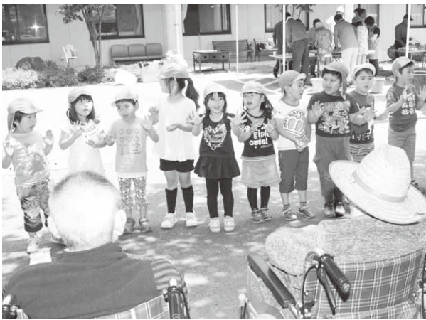
元気いっぱいに歌を披露する園児たち