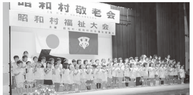
元気な歌声を披露した園児たち

に始まった、物無き時代でした。共に労を惜しまずの精神で今日にいたりました。苦有れば楽有りの希望を、まだまだ持ちたいと思います。これまで、目まぐるしく過ぎ去った時代も年月を重ねられたのも、健康が一番の幸せだったと思えます。これからも体に気をつけ、地域社会に多少の糧となればと努めたいと思います」と謝辞を述べました。