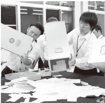
役場会議室で行われた開票作業