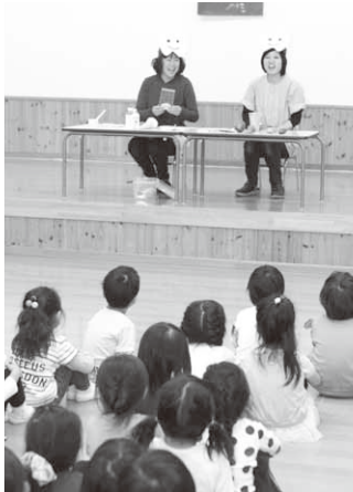
虫歯予防のお話(子育保育園)

ている部分。きちんとみがきましょう」と歯の模型を使って正しいブラッシングの方法を実演。園児たちは鏡とにらめっこしながら歯磨きの練習をしました。