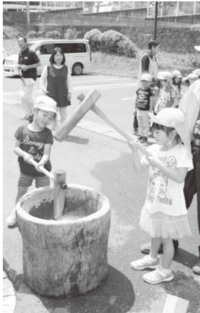
園児も餅つきに参加

また、交流会の最後には園児たちが「いつまでもお元気でいてください」とあいさつをして、お年寄りのみなさんにお別れをしました。