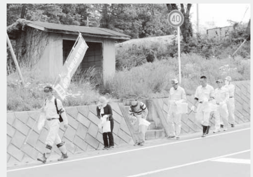
清掃活動を行う参加者

清掃活動には、およそ250人が参加。同公園周辺や望郷ラインでの清掃活動を行いました。