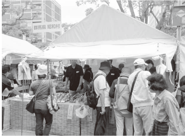
大勢の人でにぎわう昭和村のテント