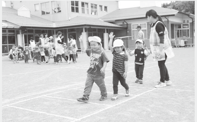
横断歩道を渡る練習(第一保育園)

講話の後には横断歩道の渡り方を練習。年長組の園児たちは道路に出て練習し、その他の園児たちは園庭につくられた横断歩道を渡る練習をそれぞれ行いました。