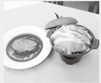
黒豚を使った自慢の料理

昭和の森山荘では、地元産の食材を使ったメニューを提供し、利用客に喜ばれています。