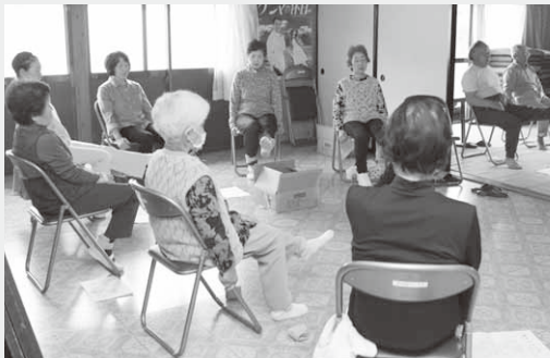
らくらく筋トレ体操で筋力アップ

森上サロンは、森下上組の皆さんが集まり、3月に立ち上げたばかりのサロン。この日は16人が参加し、筋トレ体操でさわやかな汗を流した後、茶話会を楽しみました。皆さんの参加をお待ちしています。