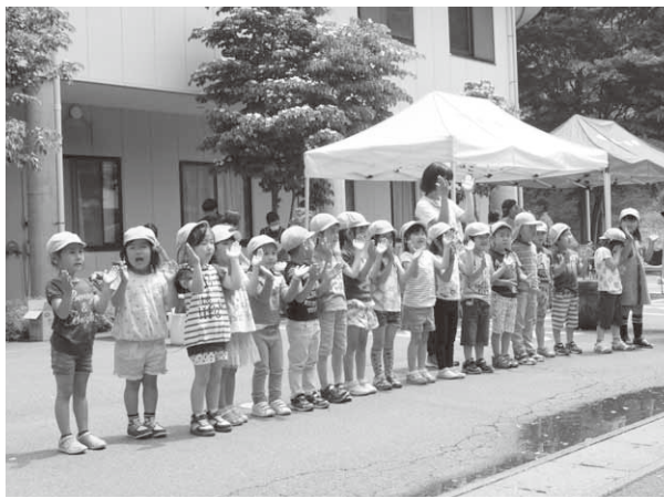
元気いっぱいに歌を披露する園児たち