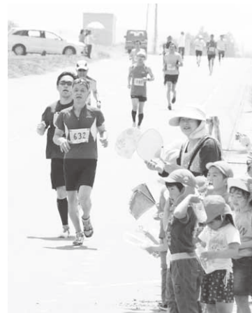
園児たちがランナーを応援