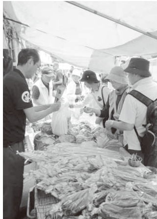
新鮮野菜がずらり

第85回横浜開港記念バザーが5月31日から6月6日にかけて横浜公園で開催され、村もPRのため、出店しました。このバザーは横浜の開港記念日である