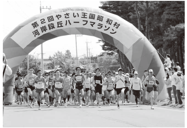
一斉にスタートを切るランナー