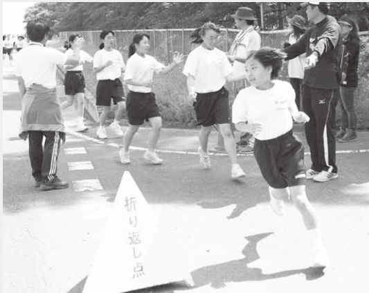
折り返し地点を通過