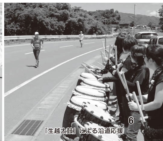
「生越太鼓」による沿道応援