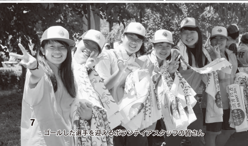
ゴールした選手を迎えるボランティアスタッフの皆さん