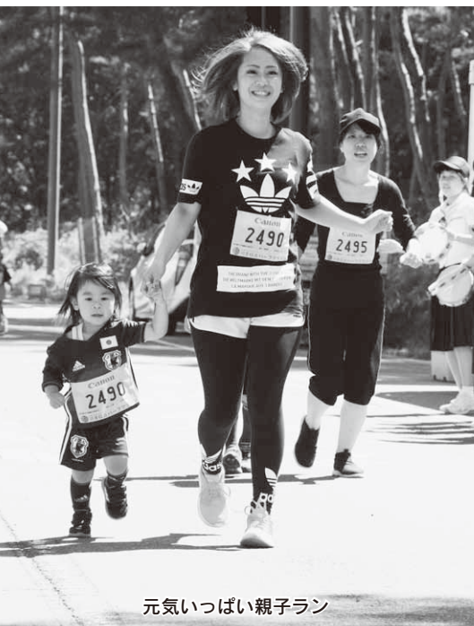
元気いっぱい親子ラン