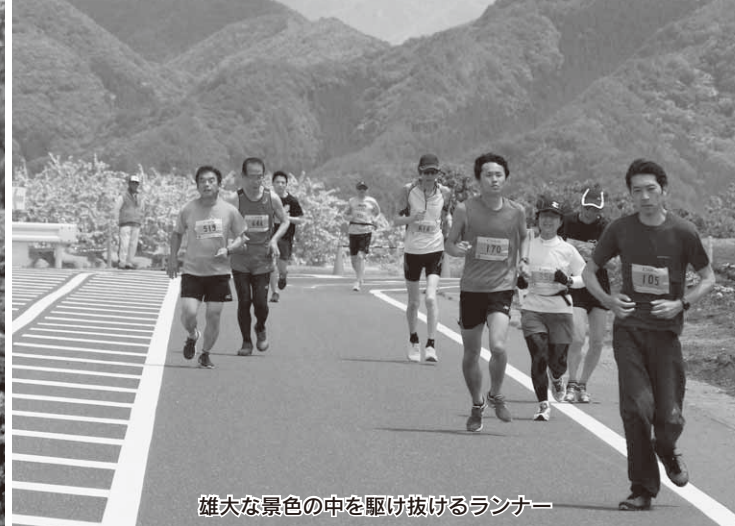
雄大な景色の中を駆け抜けるランナー