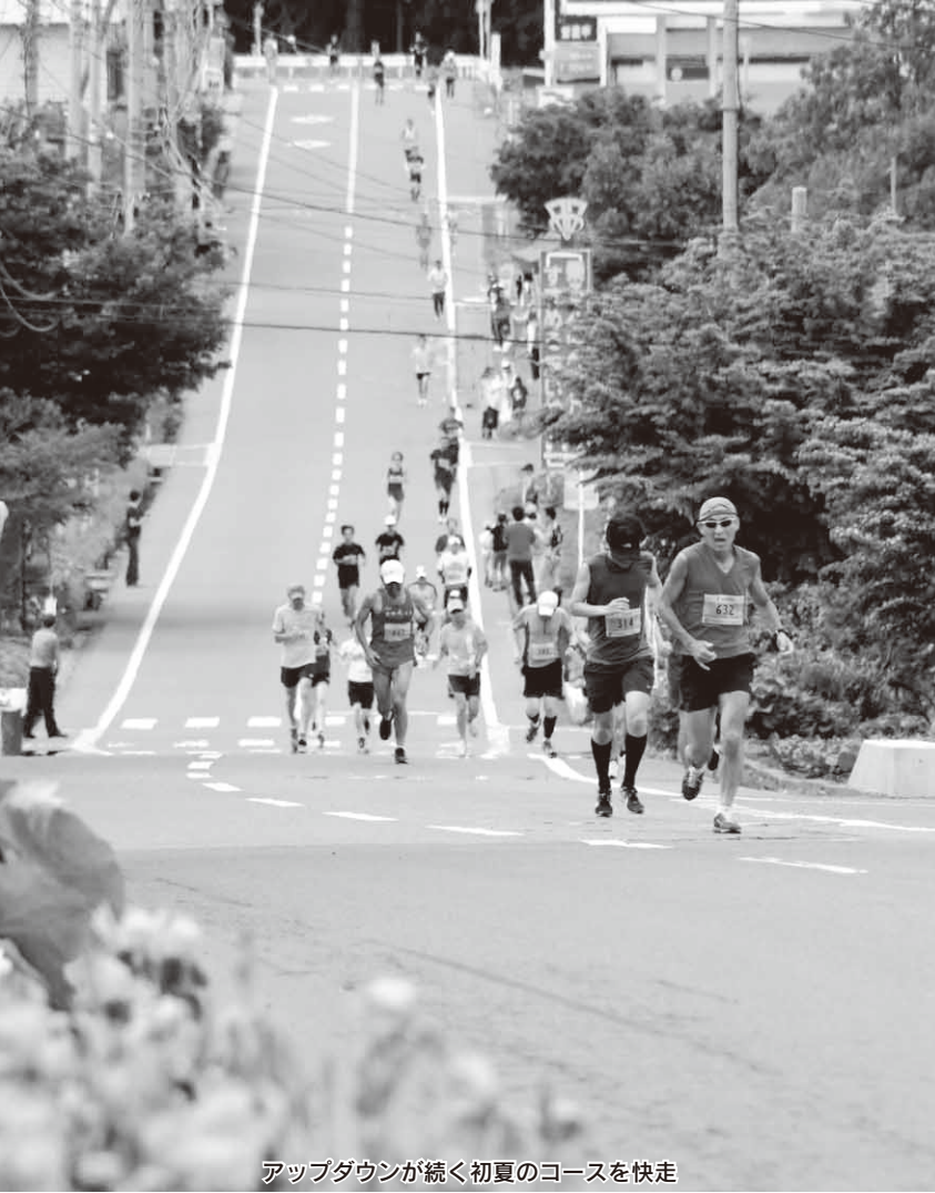
アップダウンが続く初夏のコースを快走