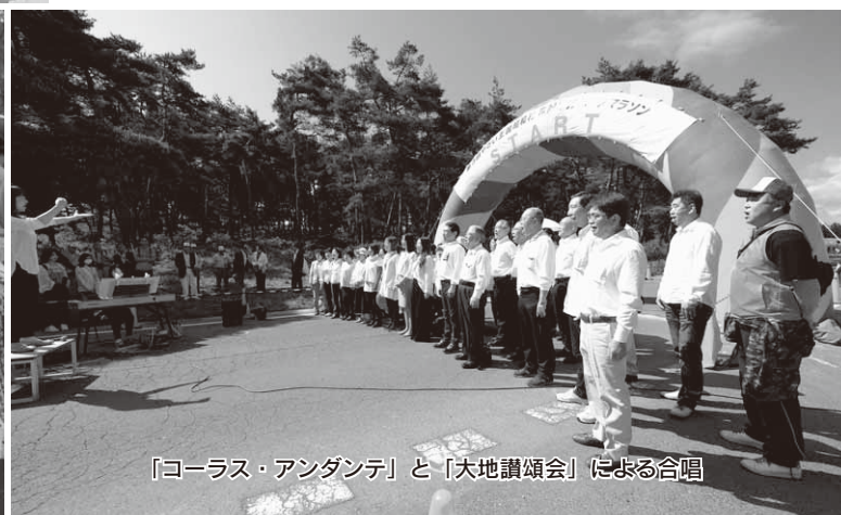
『コーラス・アンダンテ』と『大地讃頌会』による合唱