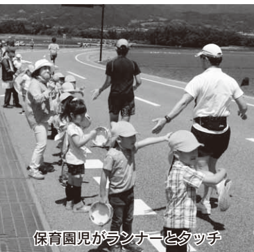
保育園児がランナーとタッチ