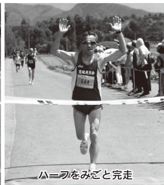
ハーフをみごと完走