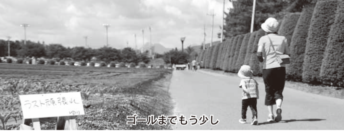
ゴールまでもう少し