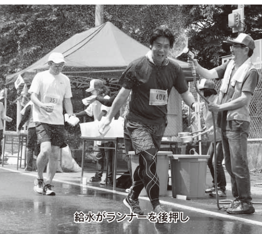
給水がランナーを後押し