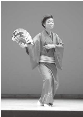
見事な舞いを披露

発表会では、村舞踊協会に加盟する5団体がそれぞれ日頃の練習の成果を発表。午前と午後の2部、48演目にわたって見事な舞踊を披露し、会場に詰めかけた観客を魅了しました。