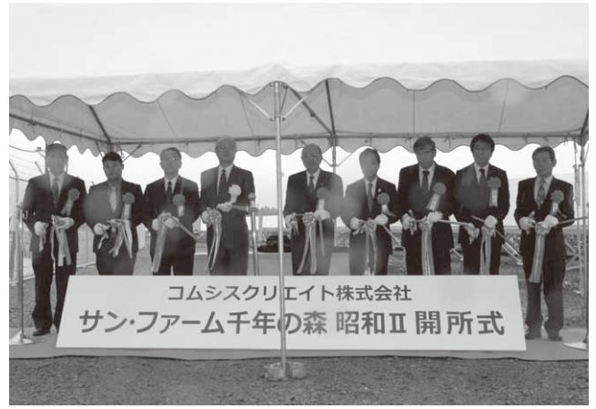
開所を記念したテープカット(千年の森)