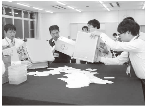
役場会議室で行われた開票作業

第48回衆議院議員総選挙が10月22日、村内8か所の投票所で行われ即日開票されました。今回は、小選挙区選挙(群馬第1区)と比例代表選挙(北関東ブロック)で、投票は午前7時から、開票は午後8時から役場会議室で行われました。 昭和村の当日有権者数は6,040人で、小選挙区の投票者数は3,798人で、小選挙区での投票率は62.85%で、平成26年12月に行われた同選挙の投票率を5.77%上回りました。 また同日、第24回最高裁判所裁判官国民審査も行われました。