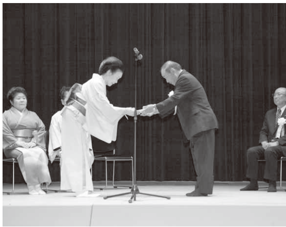
義援金は社会福祉協議会へ

また、午前の第1部終了後には義援金贈呈式が行われ、会場で募った浄財10万1,597円が竹之内会長から村社会福祉協議会に贈呈されました。