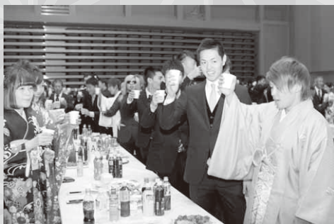
輝かしい未来に乾杯！