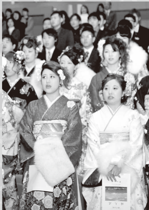
華やかな振り袖に身を包む新成人