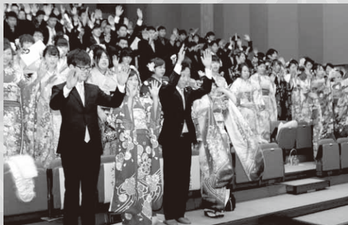
成人を祝い万歳三唱

式典後に催された茶話会では、中学校時代の恩師からお祝いの言葉が贈られたほか、抽選会なども行われ、新成人の皆さんは友人や恩師との懐かしい再会を喜び合い、笑顔とともに思い出話に花を咲かせていました。