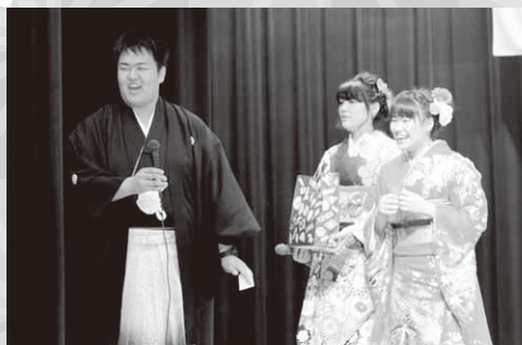
盛り上がった抽選会