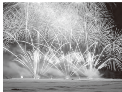
ウィンターフェスティバル