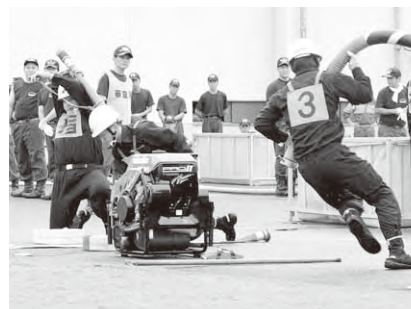
消防団小型ポンプ等購入