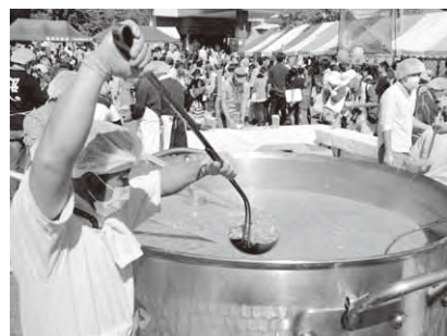
秋まつりコンニャク大鍋