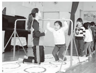
保育園の体操教室