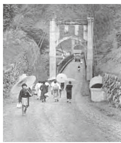
現在の前の木造吊り橋 (昭和30年頃)