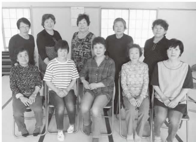
「働いた後でも元気にやっています♪」と頑張る皆さん

・筋トレ体操を続けていたら膝の動きが良くなった・満更でもない・お茶のみとおしゃべりが楽しい・世間話も大事・料理教室みたい・笑いが絶えない・みんなに会えるのが楽しみなど