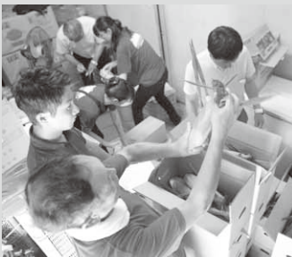
どうもろこしの発送作業

堤村長は、「昭和村を応援いただいている方々の一助になればありがたい。一日も早い復興と、笑顔あふれる生活が戻ってほしい」と語りました。