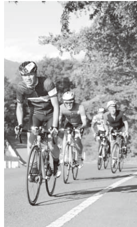
望郷ラインを疾走

利根沼田地域の美しい風景を楽しみながら望郷ラインを自転車で駆け抜けるイベント「望郷ライン・センチュリーライド2018」が8月26日、村総合運動公園