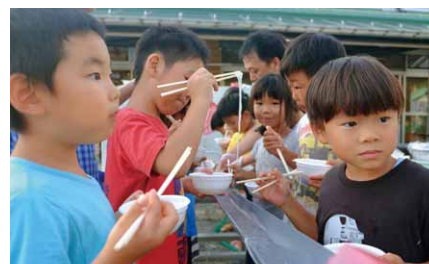
流しそうめんを楽しむ園児たち

第一・第二保育園で宿泊保育が行われました。第一保育園では、年長児17名が参加。園児たちは、手作りしたカレーライスや流しそうめんを食べ、夜はレクリエーションを楽しみ、思い出に残る夜を過ごしました。