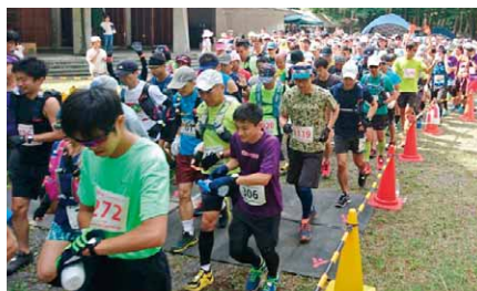
スタートを切った参加者

第3回赤城の森トレイルランが、赤城林間学園周辺の林道などで開催されました。天候に恵まれた当日は、15kmの部、30kmの部併せて約600名が参加。参加者は、さわやかな気候の高原を駆け抜けました。