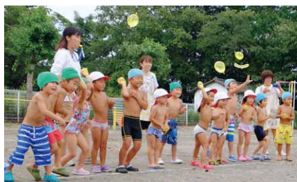
水風船におっかなびつくり

村内各保育園でプールおさめが行われました。第二保育園では水風船を投げ合う「水風船合戦」と、プールに放されたドジョウを捕まえる「ドジョウすくい」を行い、園児は今年最後のプールを楽しみました。