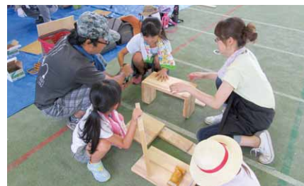
親子で力を合わせて製作

夏休み木工体験教室が多目的屋内運動場で開催されました。当日は、児童と保護者ら約40人が参加。村商工会建築部会員の指導を受け、のこぎりや工具などを使い、本立てや棚などの木工品を製作しました。