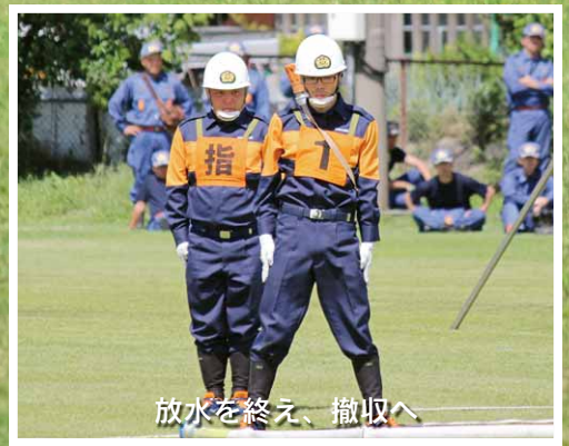
放水を終え、撤収へ