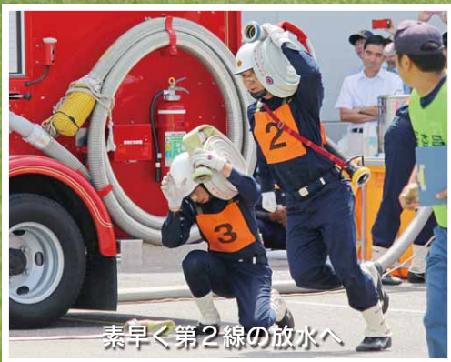
素早く第2線の放水へ

ポンプ車の部で第9分団が3番目に、また、午後には小型ポンプの部が行われ、第5分団が2番目にそれぞれ登場。両分団は、多くの人々が見守る中、これまでの訓練の成果を発揮、気迫のこもった正確な操作を披露し、第9分団が優勝、第5分団が準優勝の栄冠に輝きました。このほか、個人表彰として受賞した各選手に優秀賞が贈られました。 〈大会成績〉 ▼ポンプ車の部 優勝 昭和三村消防団第9分団 準優勝 みなかみ町消防団第2分団 第三位 太田市消防団第12分団 ▼小型ポンプの部 優勝 館林消防団第10分団 準優勝 昭和三村消防団第5分団 第三位 安中市消防団第13分団