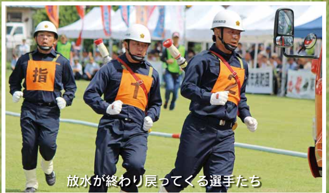
放水が終わり戻ってくる選手たち

寒い雪の日も、猛暑や雨が降る日も、選手や団員が一丸となつて訓練を重ね、全員で優勝を勝ち取ることができました。家族の支えや広域消防の方々のご指導、そして関係する多くの皆さまのご協力に感謝いたします。本当にありがとうございました。