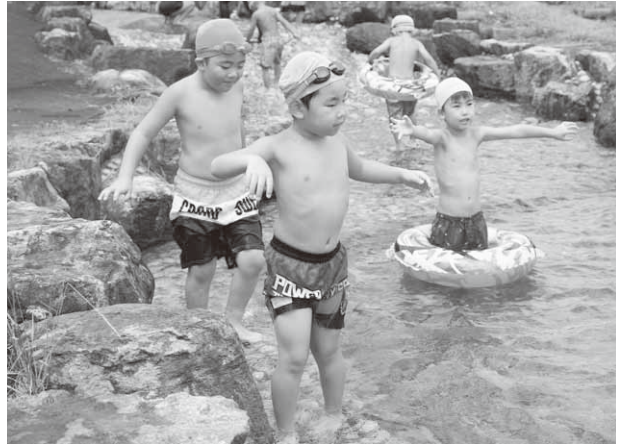
水遊びを楽しむ園児たち