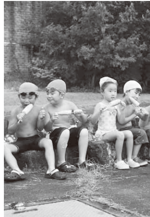
焼きとうもろこしに舌鼓

赤城西麓土地改良区は、村内各保育園の園児たちを沼田市利根町の同改良区調整池に隣接する親水公園に招待しました。これは村の農業を支える同改良区の農