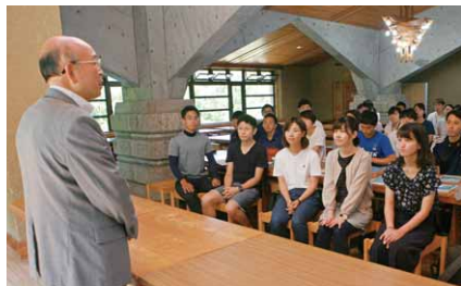
村長のあいさつに耳を傾ける参加者

横浜市の新規採用教員を対象とした初任者研修が村内で行われました。当日は79人が参加。村と横浜市との友好交流の説明やこんにやくづくり体験などが行われ、参加者は昭和村との交流について理解を深めました。