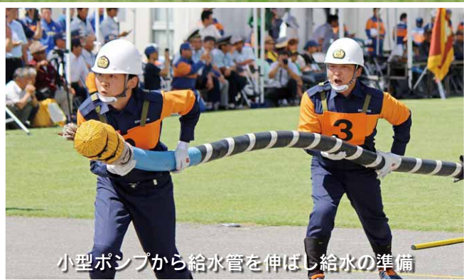
小型ポンプから給水管を伸ばし給水の準備

選手や団員が同じ目標を目指し、1年間力を合わせて訓練し県大会に臨みました。これまで、団員の家族や地域の皆さまの支えがあり、また広域消防の方々のご指導や、関係者の皆さまのお力と応援をいただきました。本当にありがとうございました。