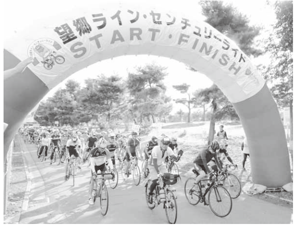
総合運動公園をスタートする参加者