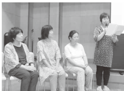
サロン紹介をする ハッピークラブの皆さん

サロン紹介の後は、うすねニューススポーツクラブの指導員の方にラジオ体操を教えていただき、ラジオ体操の曲がかかると自然に体が動き、楽しい時間を過ごしました。