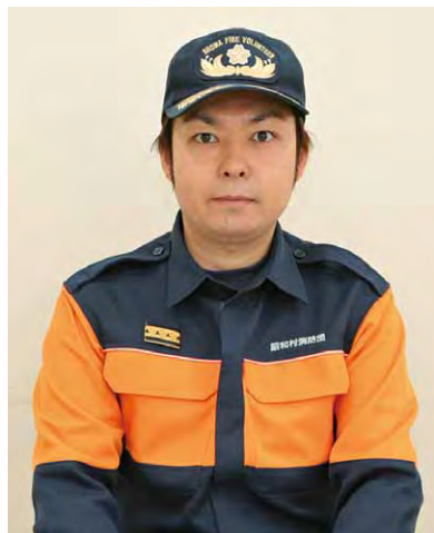
第7分団 (管轄:糸井地区)