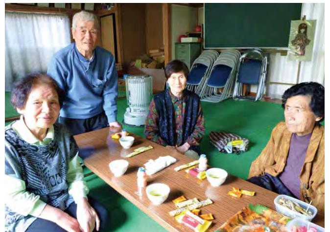
「自分のために」と頑張るみなさん

・集まる場があるのは嬉しい・生活にはり合いが出る・元気に歩けるのが嬉しい・サロンが楽しみで、その日だけは畑仕事を休んで参加している・みんなに会うと元気になる など