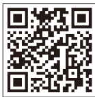
雨量監視システム