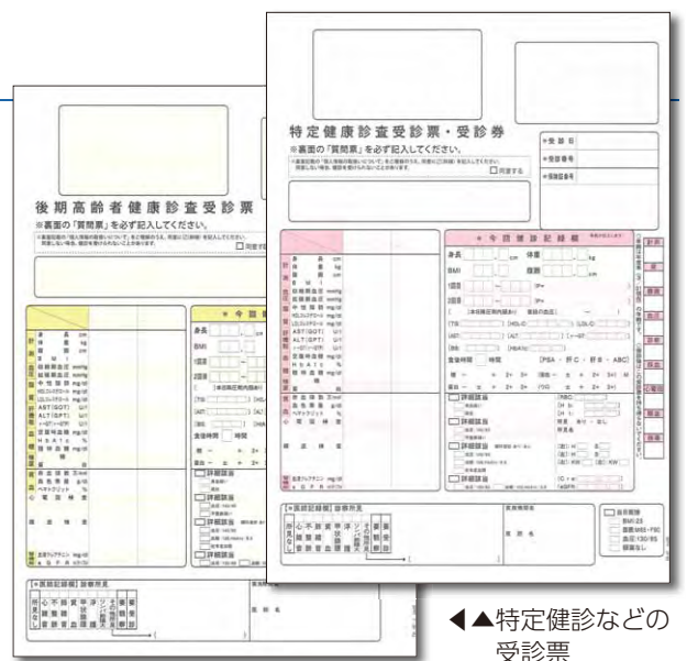
◀◀ 特定健診などの受診票