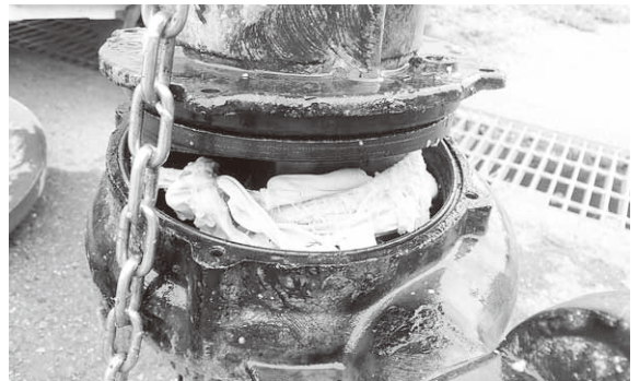
下着など衣類が流され詰まったことも