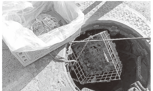
大量に流されたマスクが詰まりの原因に

農薬、農薬器具の洗浄水、石油類、食用油、家畜の糞尿、マスクなど衛生用品、生理用品、石、木片、プラスチック、生ごみ、衣類、雨水など