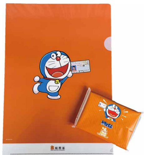
▲ クリアファイルやティッシュをプレゼント!