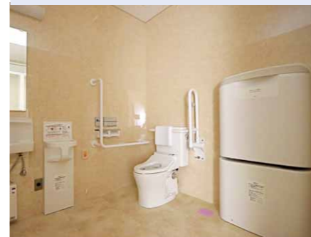
▼お手洗い(多目的トイレ)