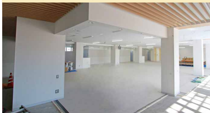
▼正面玄関入ってすぐの総合窓口です。