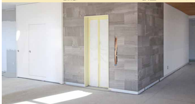
▼バリアフリーに配慮し、エレベーターが設置されます。