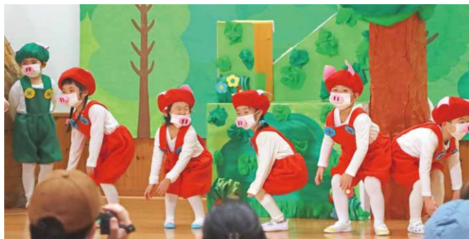
もりのおふろ(上・第二保育園)、クリスマス会(下・第一保育園)、さんびきのこぶた(右・子育て保育園)

第二保育園、子育て保育園で発表会が行われ、園児たちが日頃練習した歌やおゆうぎなどを披露。保護者から大きな拍手が送られていました。第一保育園ではクリスマス会が開かれ、サンタクロースが登場しました。