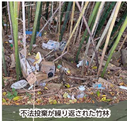
不法投棄が繰り返された竹林