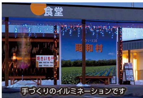
手づくりのイルミネーションです

をします。そんな私は雪かきが苦手です。経験が少ないので作業が遅く、雪をきれいにかけないからです。今シーズンは雪かきを頑張ろうと思います。 話は変わり、道の駅で冬季限定でイルミネーションを設置しました。正面看板付近を彩っています。点灯時間は16時から20時頃です。ぜひご覧ください。