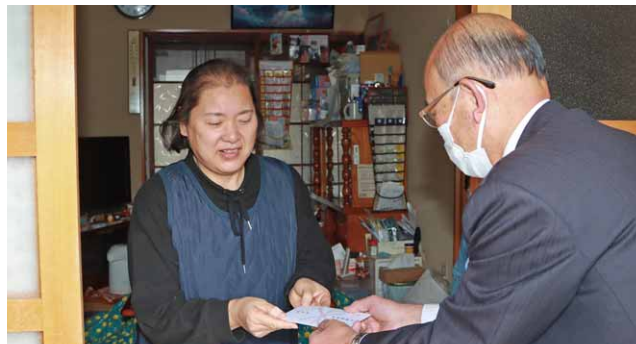
介護する家族を労う堤村長

村は、在宅介護をしている方に介護慰労金を支給しました。この慰労金は、毎年12月から翌年11月までの一年間、要介護度が4以上に相当する高齢の方を継続して在宅介護している方に対して支給しています。