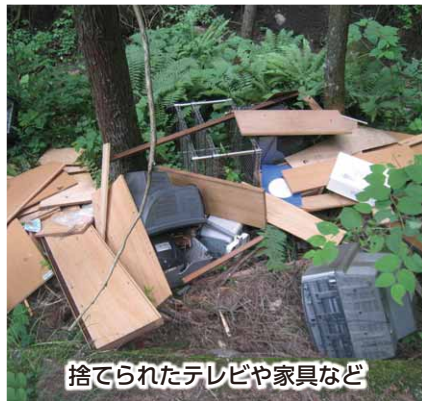
捨てられたテレビや家具など

を目撃した場合は、危険を伴いますので、直接注意はせず直ちに関係機関へ連絡してください。 不法投棄は、そのまま放置しておく、投棄物が増えたり、火を点けられたり、新たな犯罪を誘発する要因にもなります。不法投棄をしない・させない対策の徹底をお願いします。