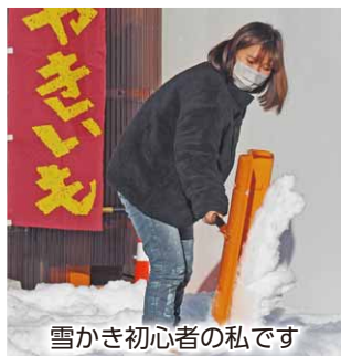
雪かき初心者の私です

こんにちは。今日はクリスマス次の日(12月26日)です。クリスマス寒波の影響で昭和村全域ではイブの前から今朝までかなりの雪が降り、白銀の世界になりました。 やはり、私はまだ根っからの群馬県民にはなれていないようで、雪が降るとワクワクし、写真を撮ったり雪を触ったりしていました。 道の駅に出勤すると、夜の間に降った雪が施設内を埋め尽くしているので、まず始めにスタッフが雪かき