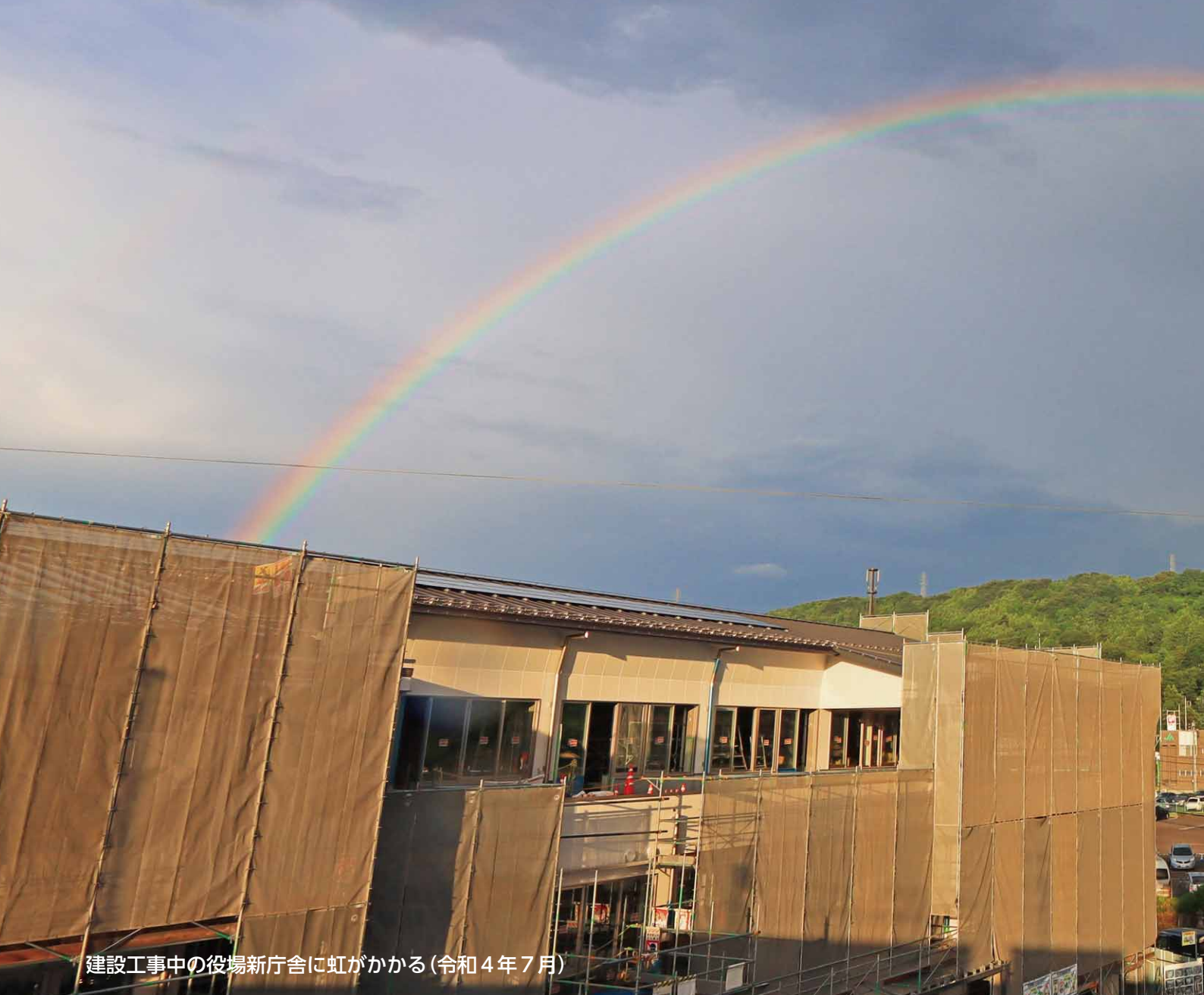
建設工事中の役場新庁舎に虹がかかる(令和4年7月)

日本でも衝撃的な事件が発生しました。7月8日、参議院議員通常選挙のため、奈良市で街頭演説を行っていた安倍晋三元首相が銃で撃たれ、搬送先の病院で亡くなられました。このような民主主義の根幹を揺るがす許しがたい暴挙に、強い憤りを禁じ得ません。