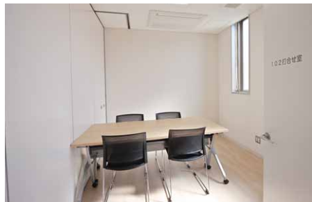
プライバシーに配慮した相談室