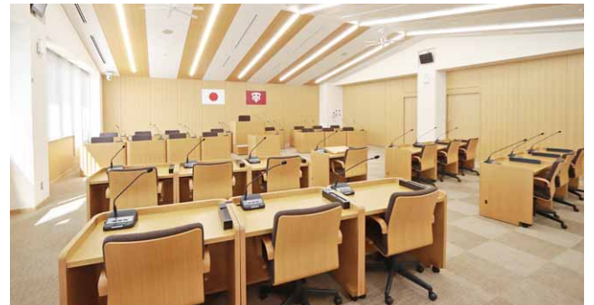
▲落ち着いた雰囲気の議場。設置されている机や椅子は可動式のため、会議室としても活用できます。