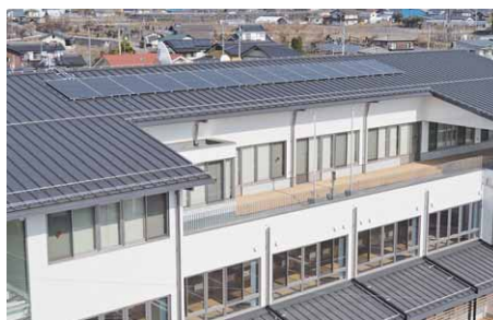
災害に強い太陽光発電システム

村の防災拠点としての機能を十分に発揮し、耐震性を備えた耐久性のある災害に強い庁舎です。