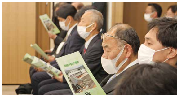
▲新庁舎のパンフレットを見る参加者

い、開かれた庁舎であるとともに、総合窓口の設置やワンストップサービスの導入により来庁者の利便性や満足度の向上に配慮して参りたいと思います」と無事完成を迎えることができたことへの感謝とこれからの村政運営に対する決意が述べられました。