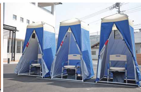
災害時の非常用トイレ