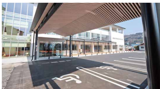
雨でも濡れないおもしろい駐車場