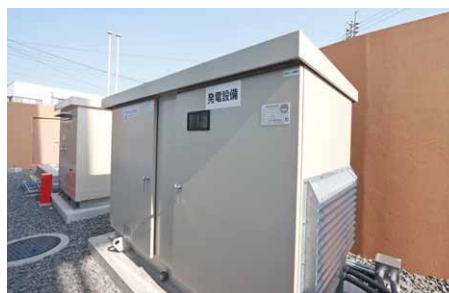
3日間電力を供給できる非常用発電機