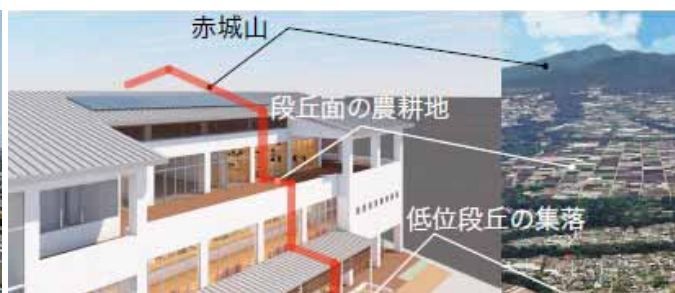
河岸段丘の景観を造形的に表した庁舎