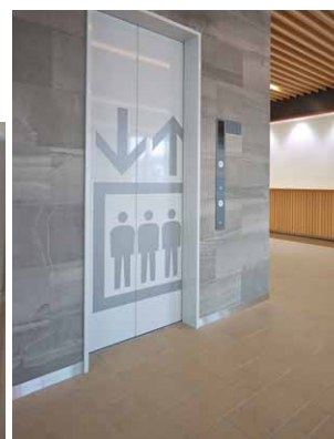
11人乗りエレベーター