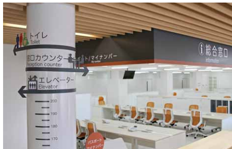
一目でわかる案内表示

初めての来庁者でも目的の場所にたどり着ける案内表示の工夫や来庁者の動線に配慮した窓口の設置、またプライバシーに配慮した使いやすい庁舎を目指しました。