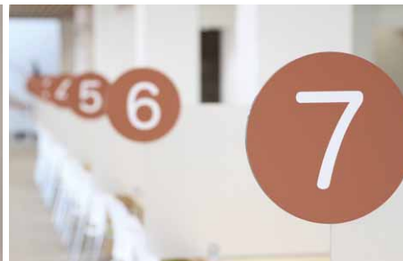
番号別に分けられたカウンター