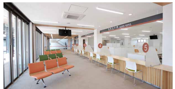
▲大きな窓から差し込む光で明るく、広々とした待合スペース。寄贈されたテレビも設置されます。

下見日で予約がなかった物品を午前9時から正午までの時間で希望者に譲渡します。物品の受け渡しは先着順となります。数量などの制限もありません。