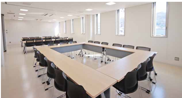
▲広々と活用できる会議室。パーティションが配備されているため、参加人数に合わせて大きさを調整できます。