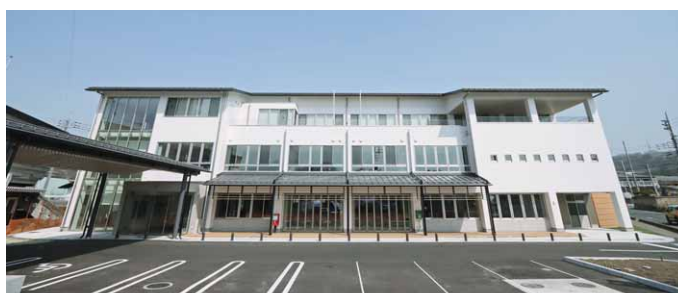
農村風景をイメージした養蚕農家型外観

日本有数の農業地域である昭和村の歴史・景観をイメージし村のシンボルとして村民に親しまれるデザインの庁舎です。