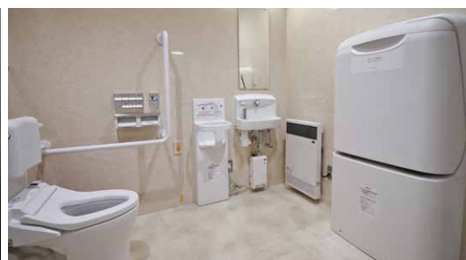
すべての階に設置された多目的トイレ