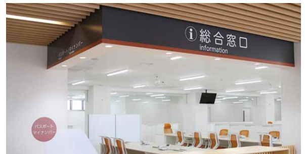
▲正面入口に「総合窓口」が新たに設置されます。各課への案内や、各種手続きをワンストップで行えます。

利用頻度の高い、住民窓口業務を1Fに集約しました。個別の打合せが必要な場合は、打合せ室も完備しています。また、プライバシーに配慮した相談室も確保しています。