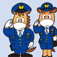
上州くん・みやまちゃん

なお、ストーカー、DV、児童虐待、性犯罪被害などに関する相談は、当直体制で24時間受け付けています。#9110は、発信地を管轄する各都道府県警察本部の相談窓口へつながります。緊急の事件・事故は「110番」をご利用ください。