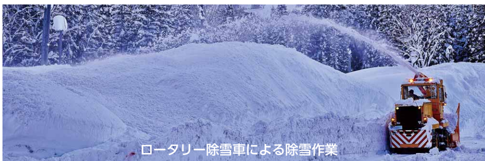
ロータリー除雪車による除雪作業