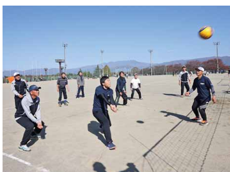
チームでボールを繋ぐ

▶各部門の優勝チーム Aの部：エース、Bの部：青春しゅわしゅわクラブ、Cの部：とりころーるB、Dの部：チームわきあいあいG、ソフトバレーボールの部：大門