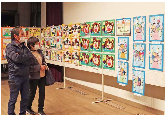
園児の力作を楽しむ来場者

来場者は、出展された数多くの絵画、生け花、盆栽や書道などの力作を鑑賞しました。また、茶道の体験教室や将棋教室なども開かれ、会場を訪れた人は楽しんでいました。