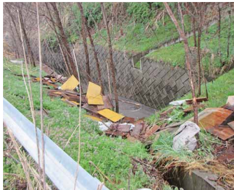
茂みに投棄された産業廃棄物