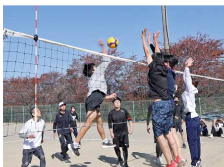
繰り広げられるネットを挟んだ攻防