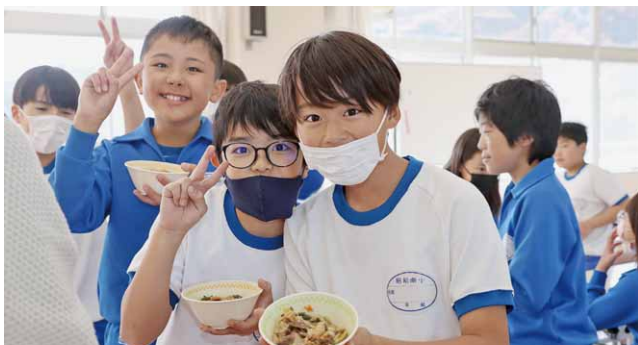
すき焼きをおかわりする児童(南小学校)

鳥山畜産食品(株)から提供された牛肉を使ったすき焼きが村内小中学校の給食に並びました。11月29日(いい肉)の日にかけて並んだすき焼きに子どもたちは目を輝かせていました。