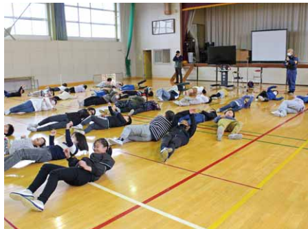
火が移ったときの対処法を学ぶ(大河原小)