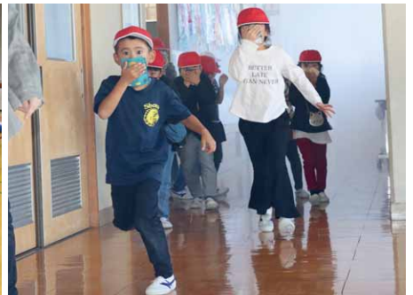
煙で白くなった廊下をあわてず避難(南小)