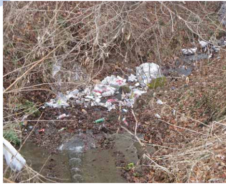
山林に投棄された一般廃棄物

道路周辺のポイ捨てだけでなく、人目につきにくい荒廃地や山林など、村内でも悪質な不法投棄が増加しています。