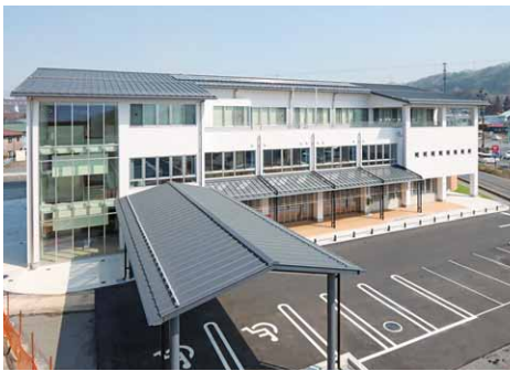
現在の役場新庁舎

今日の糸井エリアでは新調された村役場をはじめ、公民館、保健福祉センター、昭和の湯、屋内運動場などの施設や各種事業所の進出により、村の中心街としての役割を担い、活気を呈している。