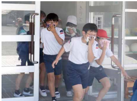
口元をふさぎ素早く避難(東小)