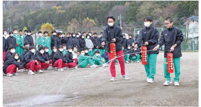
消火器を使い消火活動の予行演習(昭和中和)

東小学校と南小学校では、校舎の中で発煙筒をたき、煙が充満する中を避難しました。児童たちは実際の火災さながら、煙を吸い込まないように口元をふさぎながら避難していました。また、大河原小学校では、万が一、着衣に火が移ったときの対応を習い、体育館内で実践していました。