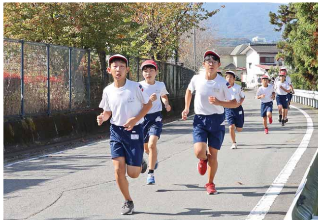
快走する5・6年生男子

学校や周辺の沿道には、子どもたちの走りを応援しようとする多くの人が集まり、声援を送っていました。