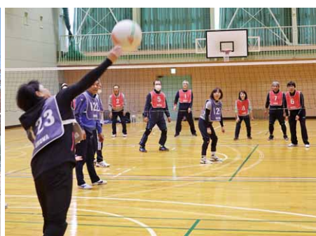
狙えサーブエース