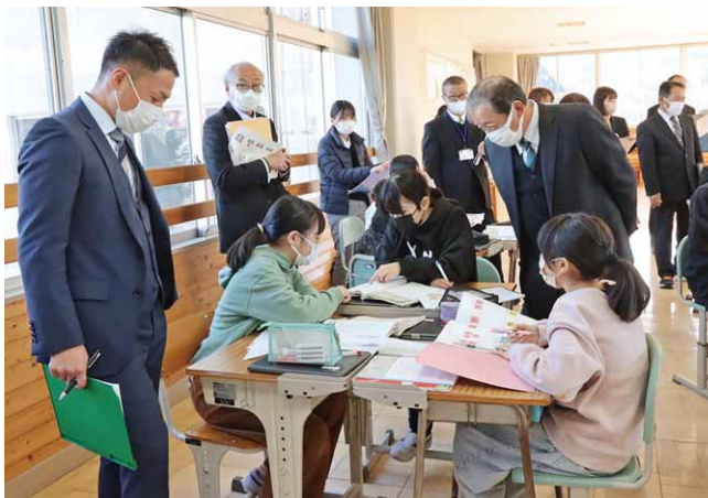
6年生が話し合いするところを観覧する教育関係者

公開された3年生の算数の授業では、籠を教室の中央に置き、同じ距離で玉を投げ入れるにはどうすればいいかを体験しながら学んでいました。また、6年生の国語の授業では、『鳥獣戯画を読む』を題材に、言葉の伝わりやすさ、伝え方を学んでいました。