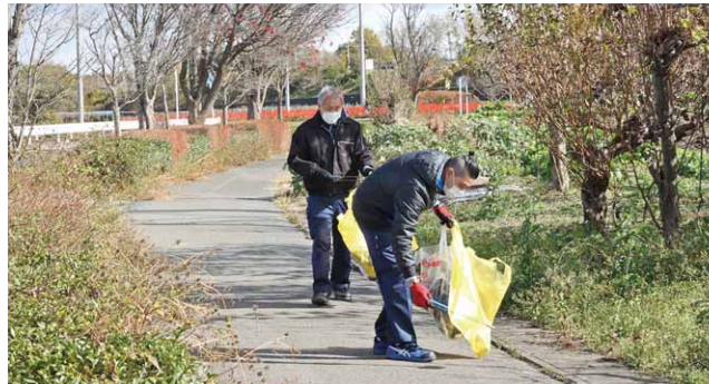
清掃活動をする参加者

関屋工業団地4社(キャノン電子株式会社、藤森工業株式会社、味の素ファインテクノ株式会社、株式会社新鮮便)が地域貢献の一環として、合同で昭和インター線の清掃活動で汗を流しました。