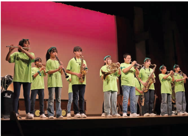
見事な演奏で会場を包み込む

第2部では、学生服から衣装を変え、観客も一緒に盛り上げられるようにとJ-POPを中心に演奏が行われました。客席からの手拍子や歓声を受け、会場全体が一体感に包まれていました。