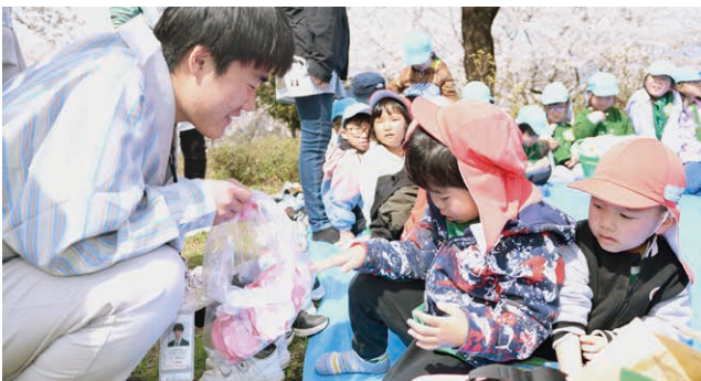
キヤノンの従業員から花飾りをもらう園児たち

第一保育園と第二保育園の園児たちが、キヤノン電子(株)赤城事業所内でお花見をしました。見上げると空を埋め尽くすほどの桜の下で、園児たちはお菓子を食べながら楽しい時間を過ごしました。