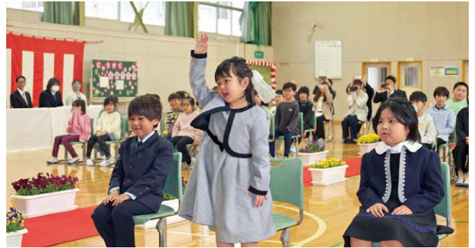
手をあげ、元気よく返事をする新入生(大河原小)

また、各小学校でも合わせて44人の新入生が入学しました。大河原小学校では、在校生のお兄さんお姉さんに見守られながら新1年生7人が入場。新入生呼名で名前を呼ばれると、手をあげて立ち上がり、大きな声で返事をしていました。