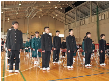
真剣な表情で式典に臨む新入生(昭和中)