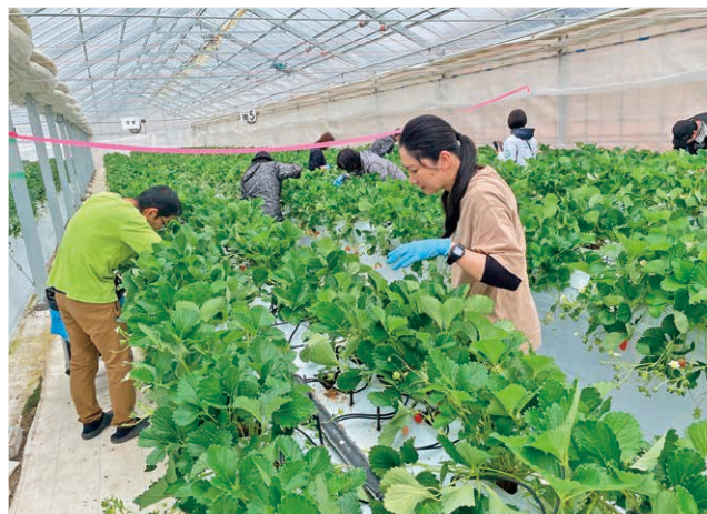
農園星ノ環で汗を流すJR職員

また、村は3月22日に、村と防災協定を結んでいる取手市の駅前で、いちごやかんにゃく製品を販売し、村の農産物をPRしました。こうした取り組みは、今後も進めていく予定です。