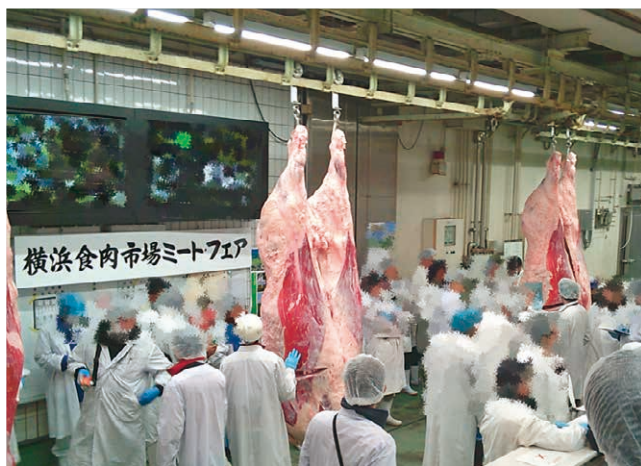
横浜食肉市場で評価される様子

このフェアには全国から152頭が出品され、厳正な審査が行われました。優秀賞に輝いた新和農産の和牛は、歩留まり・肉質ともに最高評価となるA5ランクに格付され、品質を高く評価されました。