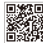
雨量監視システム

http://shouwa-staff.tenki.ne.jp 雨量観測情報と、気象情報が確認できます。 ※通信料は利用者の負担となります。