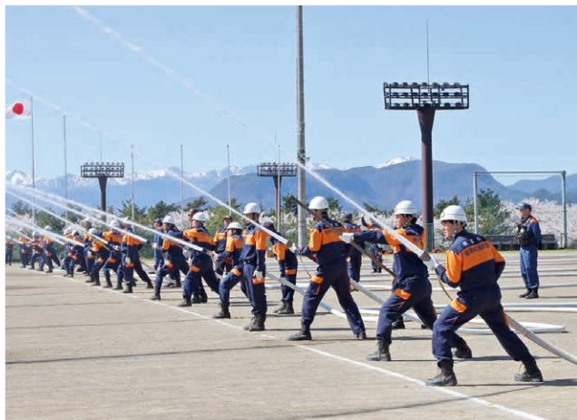
放水訓練を行う消防団員

なお、訓練に先立ち、昨年度に管轄地域での無火災を達成した第3・4・5・7・8・9・10分団に高橋村長から表彰状が贈られました。