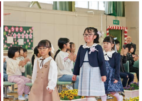
拍手の中、入場する新1年生(大河原小)