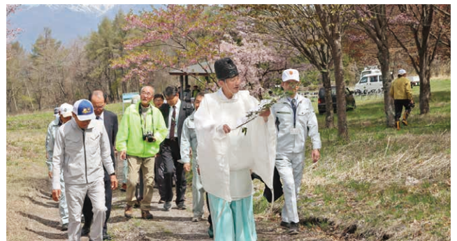
安全祈願後に行われた登り初め

登山者の安全を願い、赤城山船ヶ鼻登山道安全祈願祭が長者の原・結婚の森で行われました。この登山道は「楢水」、「牛石」の2つのコースが国有林の中に整備されており、登山愛好家に親しまれています。