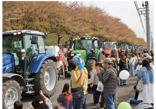
大迫力のトラクターパレード

また、道の駅ではキッチンカーの出店やしょうわむらマルシェが開かれ、多くの人々が楽しみました。