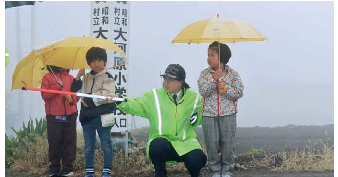
道路を横断する前に左右の確認(大河原小)

小学校では、主に3年生が自転車の乗り方を、1年生は横断歩道の安全な渡り方を学びました。また、保育園では道路や駐車場での飛び出しの危険性について、ダミー人形を使用した実演から学んでいました。