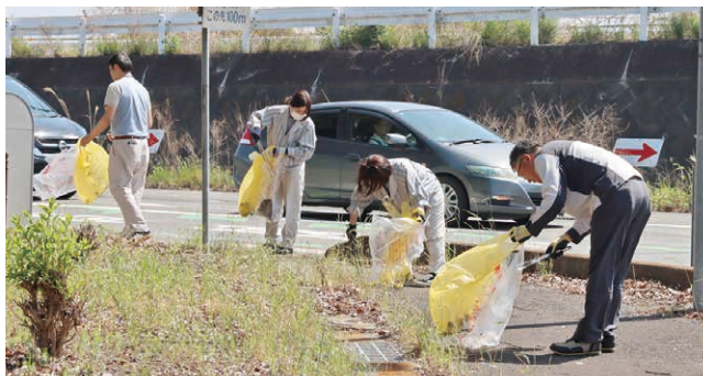
昭和インターチェンジ入口を清掃する参加者

関屋工業団地の4社(キャノン電子株式会社、ZACROS株式会社、味の素ファインテクノ株式会社、株式会社新鮮便)が地域貢献の一環として、合同で昭和インター線の清掃活動を行いました。