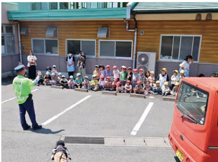
飛び出しの危険性を学ぶ(第一保育園)