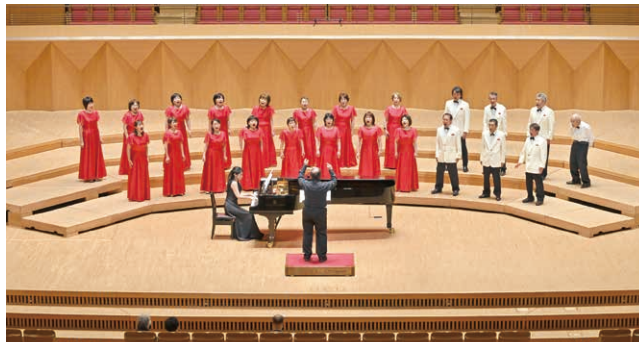
美しい歌声を聴かせたコーラス・アンダンテ

横浜市で開催された「国際シニア合唱祭ゴールデンウェーブin横浜」に村を拠点に活動する「コーラス・アンダンテ」が出演し、「愛燦燦」と「糸」を歌い、みなとみらいホールに歌声を響かせました。