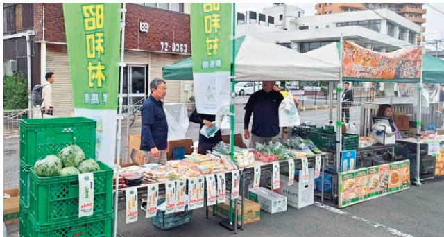
たくさんの方が訪れた村の販売ブース

防災協定都市の取手市で「取手JAZZ FESTIVAL 2026」が行われ、村のPR活動のため、こんにゃく製品や新鮮野菜を販売しました。イベントに訪れた人々に昭和村の魅力を伝えました。