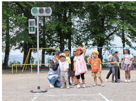
信号が青になってから(第二保育園)