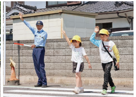
手をまっすぐに上げ道路を渡る(南小)